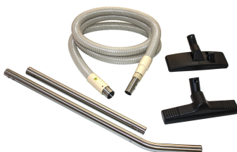
MV-1CR Tools and Accessories - Optional